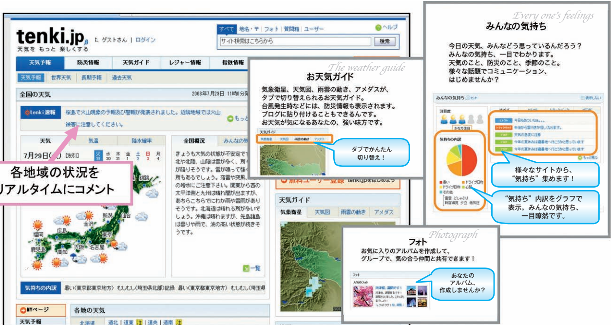
図 tenki.jp トップ・ページ (左) とコンテンツ・ページ例 (右の3イメージ)

「tenki.jp」がユーザー参加型の天気総合ポータルサイトとして全面リニューアルしました。今日の天気や季節、防災を話題に、全国のユーザーやお天気キャスターとも対話ができるミニブログ、共有フォト、質問箱などのコミュニケーション・コンテンツが充実。その他、指数情報、お天気ガイド、tenki速報、まもなく天気がくずれる地域、旬な話題についての投票、人気の指数等の各種ランキングなど、便利なコンテンツが盛り沢山です。リニューアルしたtenki.jpを是非ご利用ください。