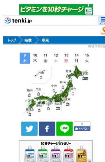
(スマートフォン専用サイトイメージ)

天気予報専門サイト「tenki.jp（てんきじえーぴー）」 http://www.tenki.jp