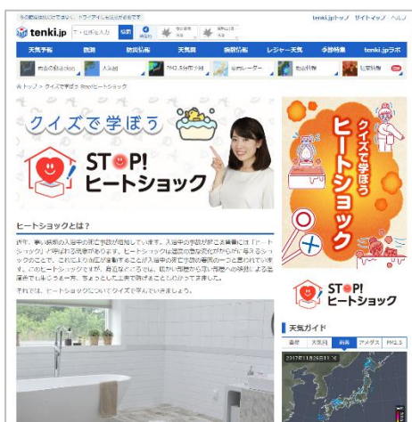
画面イメージ パソコン版

一般財団法人 日本気象協会（本社：東京都豊島区、会長：石川裕己、以下「日本気象協会」）は、東京ガス株式会社（本社：東京都港区、代表取締役社長：広瀬道明）と共同で開発した「ヒートショック予報※ 1 」に関連する新たなコンテンツとして、ヒートショックについての正しい知識・対策を学ぶことができるコンテンツ「クイズで学ぼう STOP! ヒートショック」を、2017年12月4日（月）から天気予報専門メディア「tenki.jp（てんきじえーびー）※ 2 」（パソコン版・スマートフォン版）で公開します。