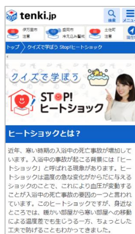
画面イメージ スマートフォン版

ヒートショックとは、寒い部屋から暖かい部屋への移動など、温度の急な変化が体に与えるショックのことです。東京都監察医務院が発表しているデータによると、冬季は入浴中の事故死が多くなる傾向があります。入浴中の事故による死亡者の多くは高齢者であり、ヒートショックが原因の一つであると考えられています。