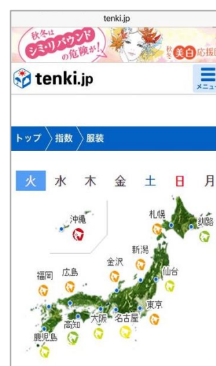
(スマートフォンサイトイメージ)