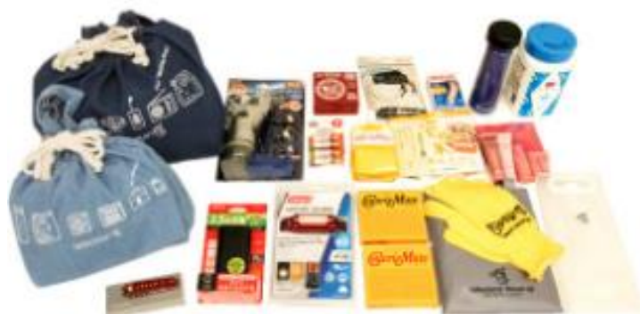
『ローリング&ストック・バッグ』+防災グッズ+マルチツールのセット イメージ