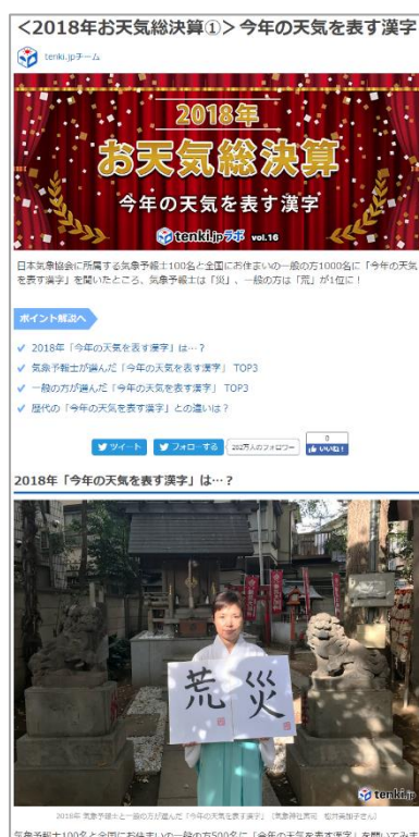
パソコンイメージ