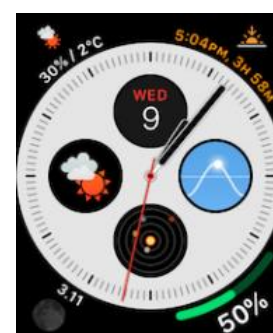
【AppleWatch コンプリケーション】