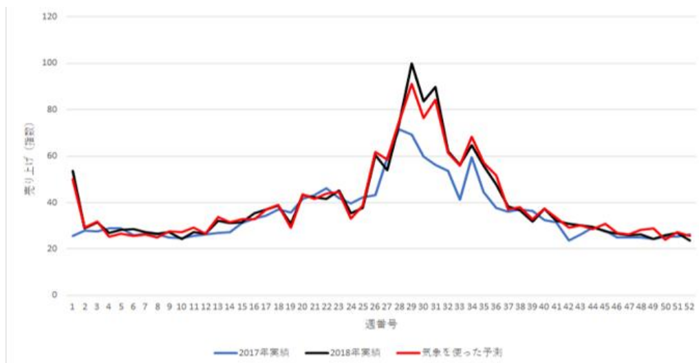
<スポーツドリンクの市場規模売上予測モデルの精度>