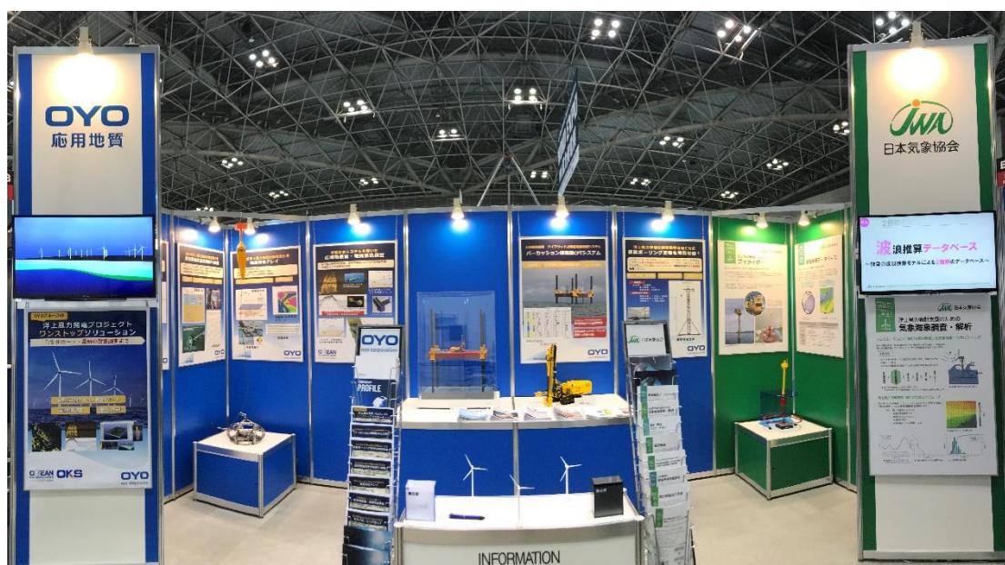
図：出展ブース外観イメージ（前回の様子）