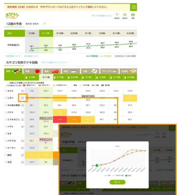
【「12週の子測」表示イメージ】