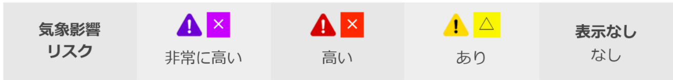
各段階の表示イメージ