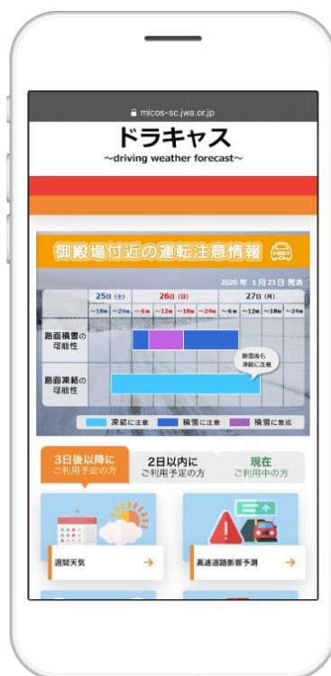
「ドラキヤス」画面（イメージ）

※本サービスでは中日本高速道路株式会社東京支社（以下「NEXCO 中日本東京支社」）が管理する、東名、新東名、圏央道などの気象情報・交通情報を提供しています。