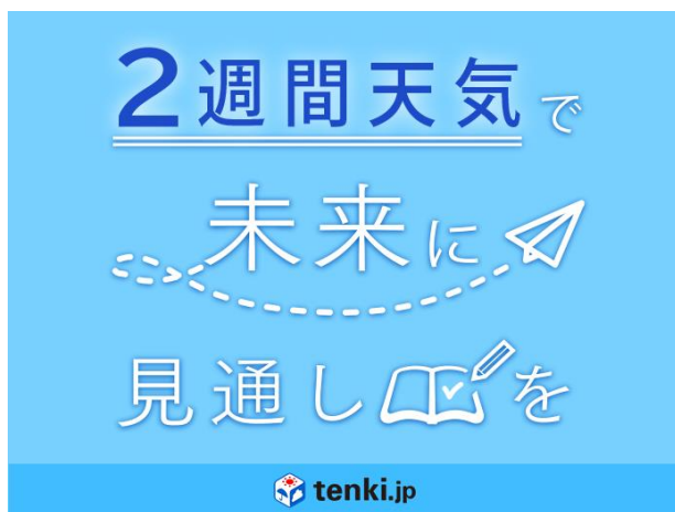
キャンペーンロゴ イメージ

2020年は新型コロナウイルス感染症の感染拡大により、未来が見えない、先が見通せない1年となりました。tenki.jpでは、日常が大きく変化する中で、日々の天気や季節の移り変わりなど、日常のなかで感じるささやかな気づきを見つめなおす機会が増えた方もいるのでは、と考えています。本キャンペーンは、tenki.jpの新たなサービスである「2週間天気」の活用を通じ、日常のなかの天気や季節の変化に気づいていただくことを目的としています。また、2週間先の天気をお伝えすることで、未来の予定に見通しを立て、少し先の未来を天気予報専門メディア「tenki.jp」と一緒に考えていただきたい、との思いもあります。本キャンペーンでは「2週間先の天気未来を計画しよう」をキーワードに、tenki.jpの日直予報士コラムやSNSにて継続的な情報発信を行います。