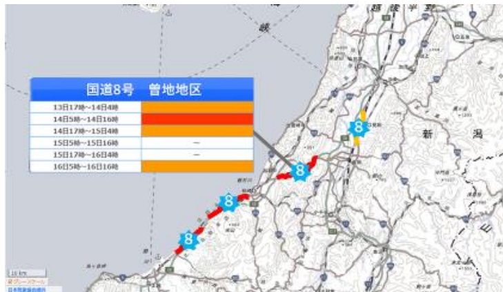
図1 提供画面イメージ(国道の雨や雪によるリスクが高い区間がひと目で把握可能)