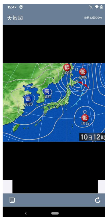
天気画像イメージ(天気図)