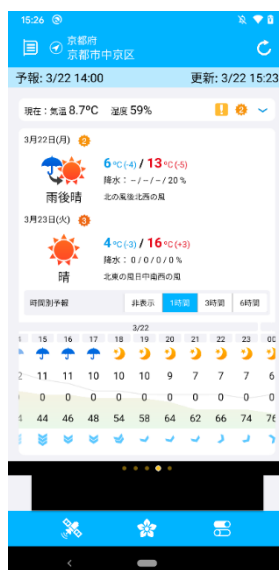
時間区切りを 1 時間毎にしたイメージ

・天気予報:今日・明日の時間別予報では、時間の区切りを 1 時間毎、3 時間毎、6 時間毎、非表示の4つに切り替えて表示していただけます。