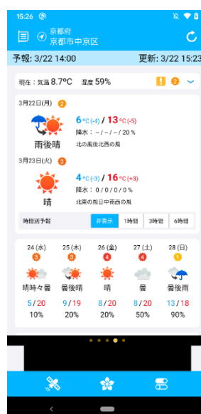
時間区切りを非表示にしたイメージ