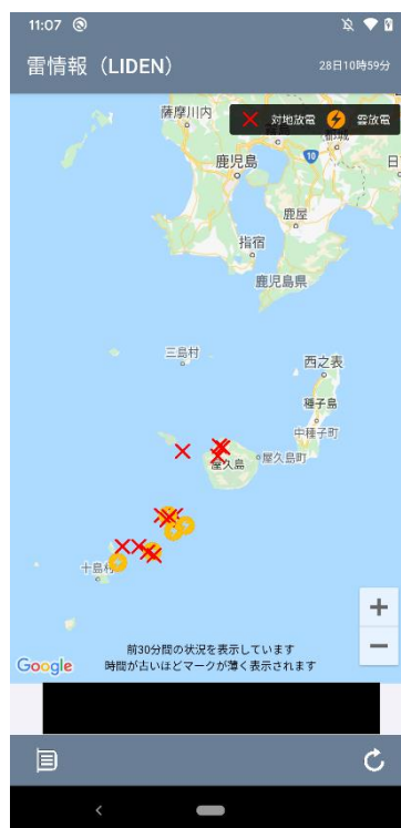
天気画像イメージ(雷情報『LIDEN』)