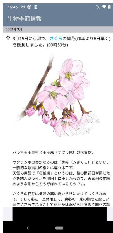
生物季節情報イメージ

・生物季節情報:うめ、さくら、あじさい、いちょう、かえで、すずきの6種類の情報について、イラスト付きでご確認いただけます。