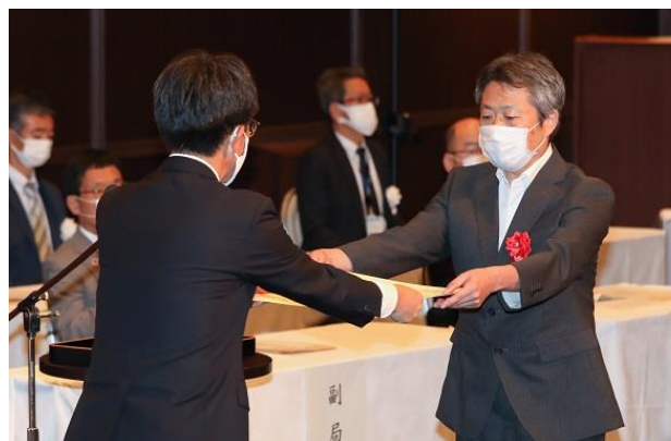
優秀建設技術者表彰