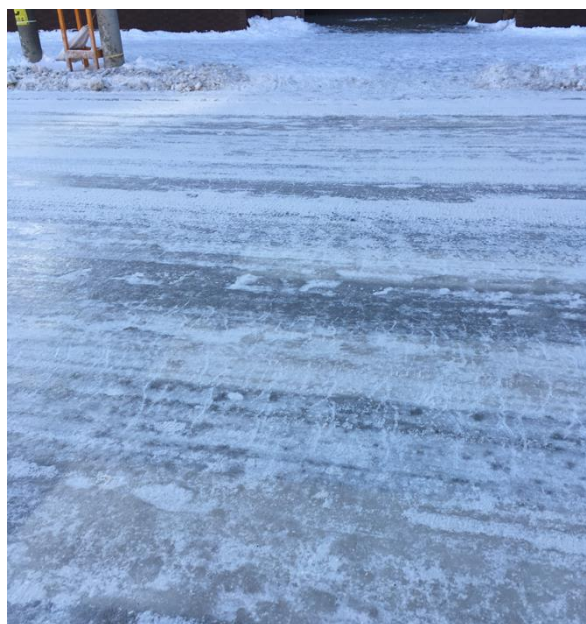
札幌市内で発生した「つるつる路面」

※『つるつる予報 (R)』は2019年度 日本雪工学会賞 技術賞を受賞しています。