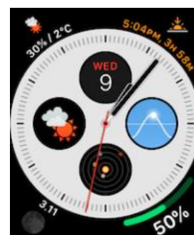
【AppleWatch コンプリケーション】