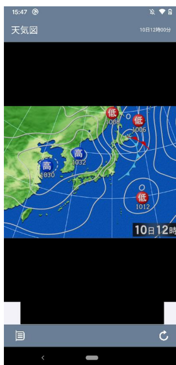
天気画像イメージ(天気図)