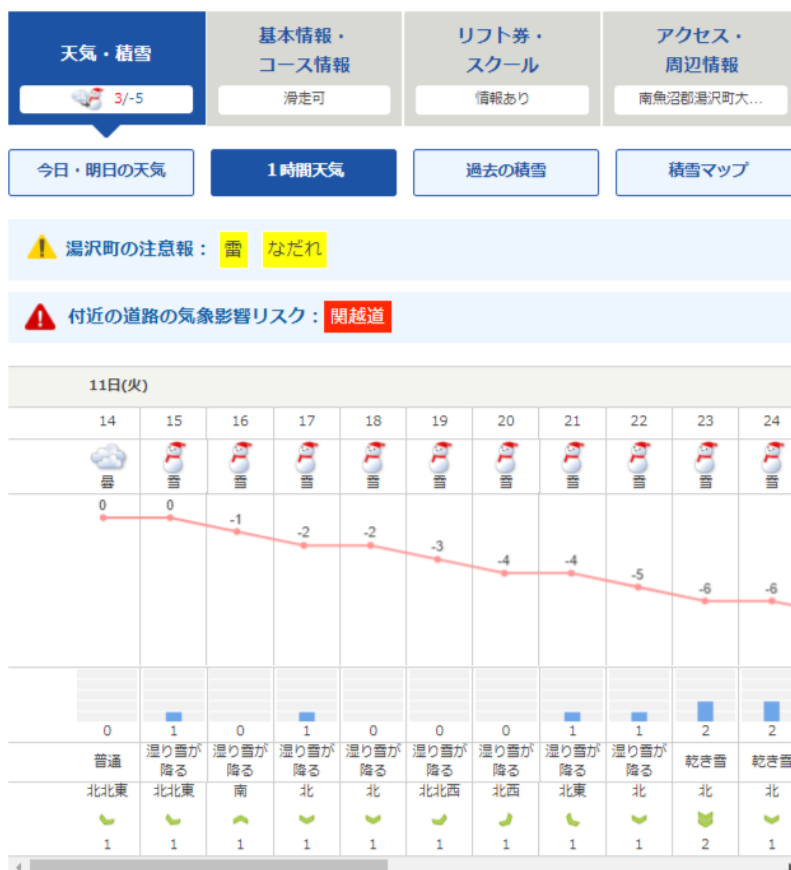
表示イメージ(1時間天気)

これまでスキー場・天気積雪情報では、各スキー場の1日ごとの天気を提供していましたが、このたび、1時間ごとの天気、気温、降雪量、雪質、風を24時間先まで確認することができる「1時間天気」の提供を開始しました。スキー・スノーボード当日の行動計画にご活用ください。