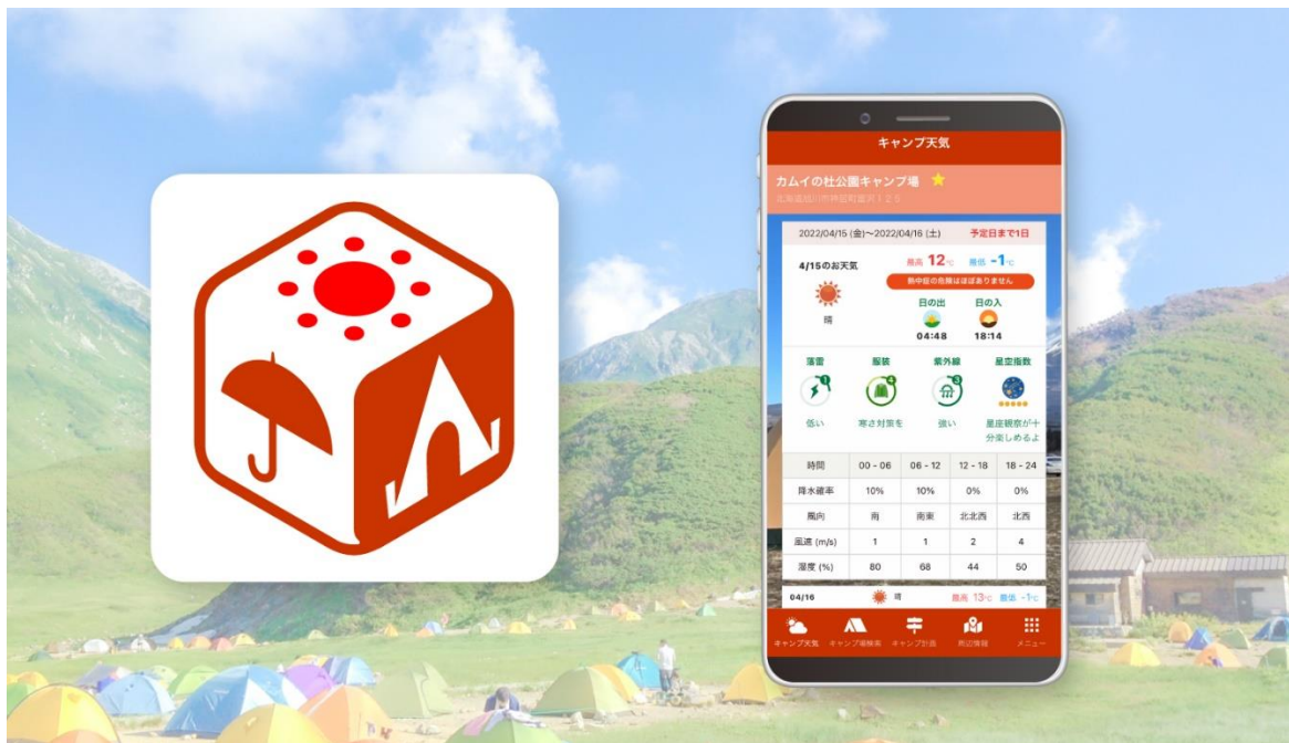
アプリアイコンとピンポイント天気予報のイメージ

一般財団法人 日本気象協会(本社:東京都豊島区、理事長:長田 太)と株式会社 ALiNK インターネット(本社:東京都新宿区、代表取締役CEO:池田 洋人)は、天気予報専門メディア「tenki.jp(てんきじえーぷり)」にてキャンプ専門のスマートフォンアプリ「tenki.jp キャンプ天気」(iOS 版・Android 版、以下「本アプリ」)の提供を、2022年4月25日(月)から開始します。