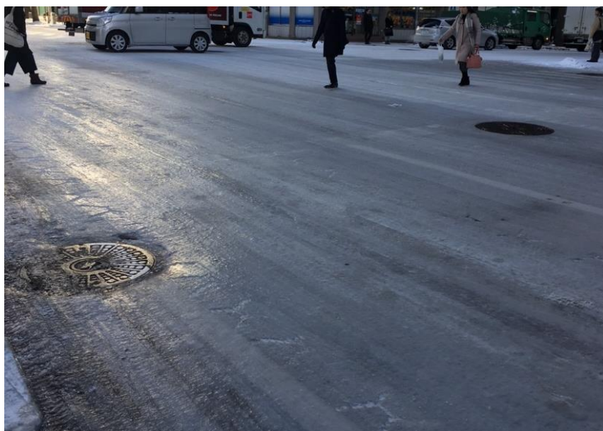
札幌市内で発生した「つるつる路面」

2021年度冬季の札幌市は幾度も大雪に見舞われ、道路の除雪作業が追いつかない状況となりました。2018年度（平成30年度）以降、冬季（11月～3月まで）1,000人を下回っていた雪道での転倒事故による救急搬送者数でしたが、2021年度（令和3年度）冬季は4年ぶりに1,000人を超え、1,296人でした。2022年1月は暖かい日が多く、湿った積雪がその後の冷え込みで凍結し、滑りやすい路面が発生したこと、また2月は大雪で除雪作業が追いつかず凸凹の歩車や車道との高い段差など、市内のあちこちで歩きにくい路面状況となったことも影響したと考えられます。