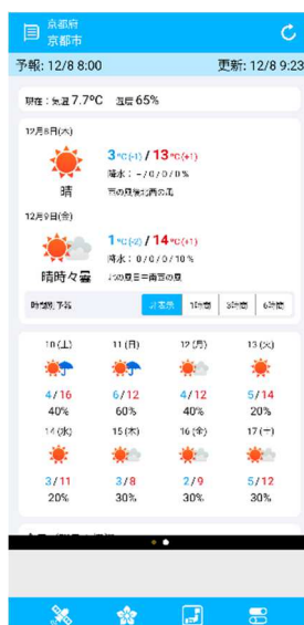
無料版 10 日間予報の画面イメージ(左上 iOS 版、右上 iPad 版、下 Android 版)