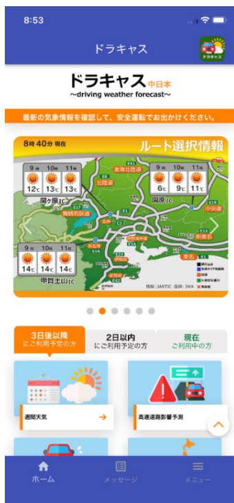
アプリでのホーム画面 (中日本版) (『ドラキヤス ~driving weather forecast~』情報)

(注) ジオフェンス技術とは：仮想的なフェンス (柵) により囲まれた任意のエリアを「ジオフェンス」と定義します。GPS による位置情報を利用してスマートフォン等の端末があらかじめ設定されたジオフェンスへ出入りした際に検知し、その検知された端末に対してのみ通知を行なう技術のことです。