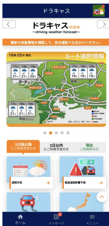
アプリでのホーム画面（中日本版） （『ドラキヤス ~driving weather forecast~』情報）

（注）ジオフェンス技術とは：仮想的なフェンス（柵）により囲まれた任意のエリアを「ジオフェンス」と定義します。GPS による位置情報を利用してスマートフォン等の端末があらかじめ設定されたジオフェンスへ出入りした際に検知し、その検知された端末に対してのみ通知を行なう技術のことです。