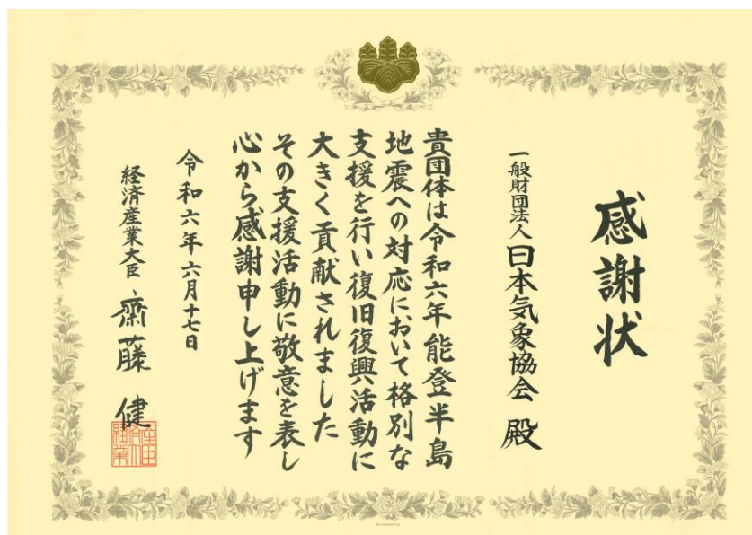
経済産業省からの感謝状

日本気象協会は、令和6年能登半島地震の復旧対応に参加したドローン企業各社が安全にドローン運航を実施できるよう、日本気象協会独自のドローン向け気象情報を提供しました。