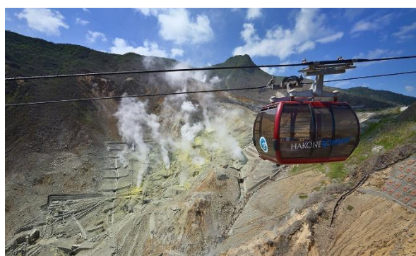
▲大涌谷を望む箱根ロープウェイ