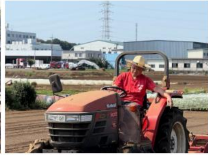
トラクタによる耕耘作業