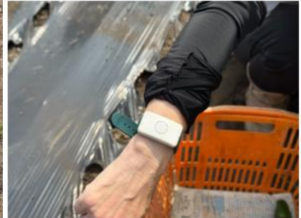
ウェアラブルデバイスの活用