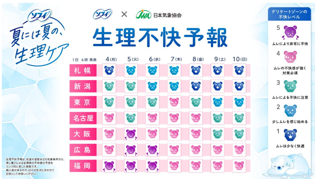
生理不快予報のイメージ

日本気象協会とユニ・チャームは『生理不快予報』の提供を通じて、年々厳しさを増す過酷な夏における女性のウェルネス向上をサポートします。